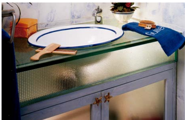
Encimera y frente de SGG BALDOSA GRABADA 19mm. Interiorismo: Miren de Mújica.