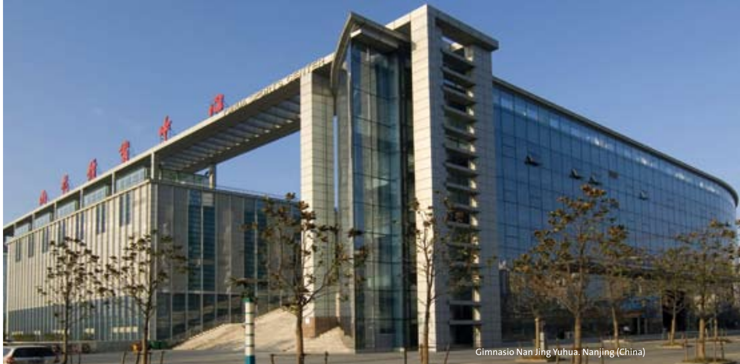
Gimnasio Nan Jing Yuhua. Nanjing (China)