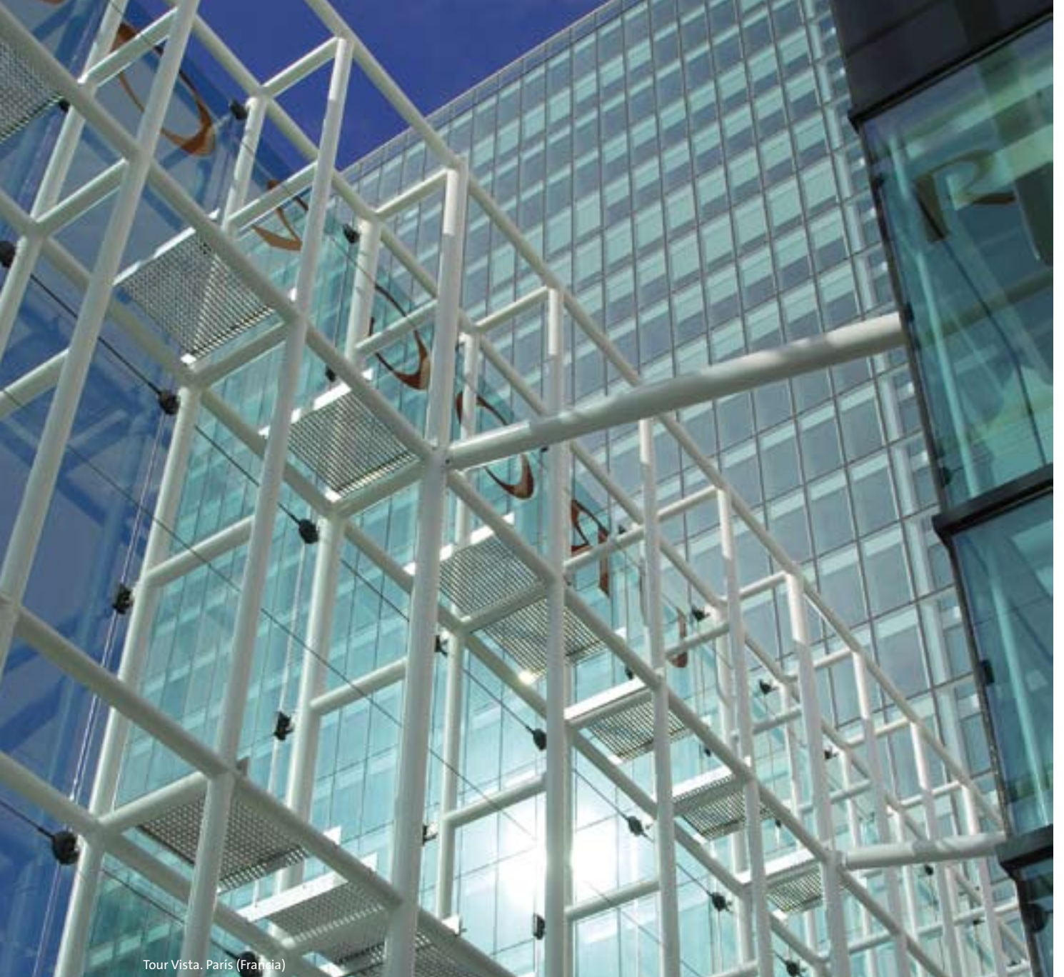
Tour Vista. París (Francia)