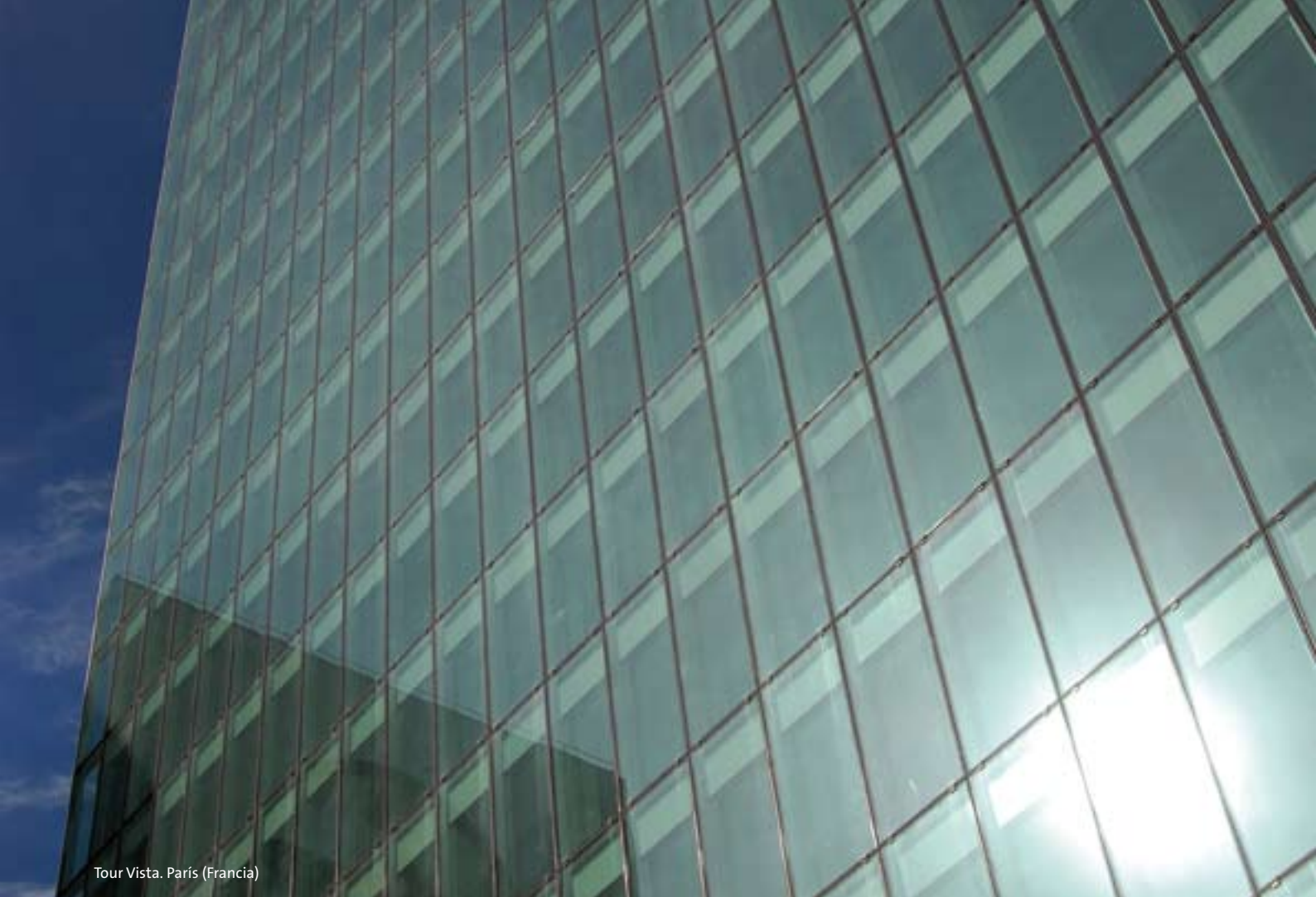
Tour Vista. París (Francia)