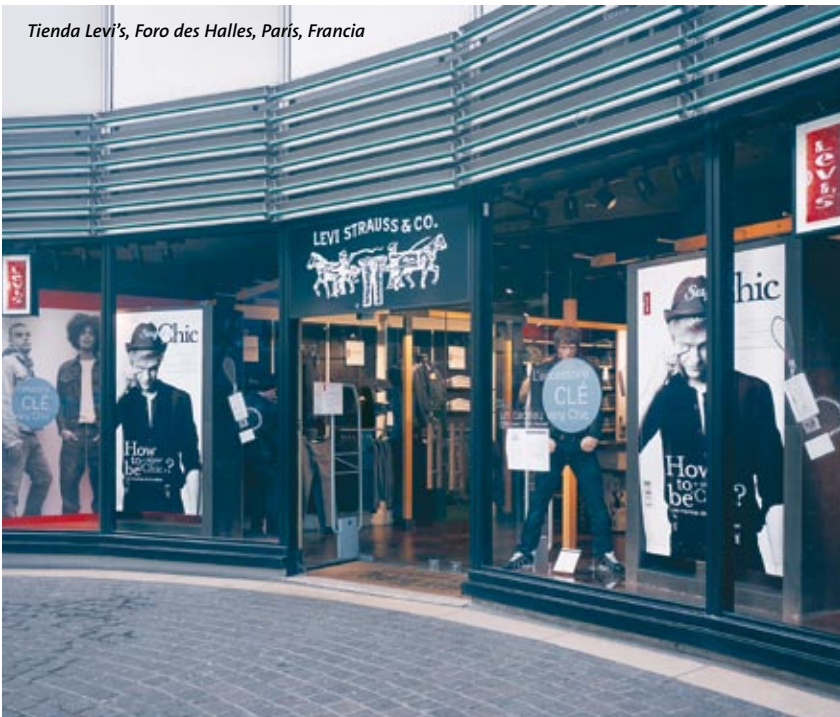
Tienda Levi's, Foro des Halles, París, Francia