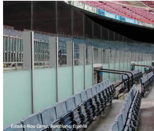
Estadio Nou Camp, Barcelona, España