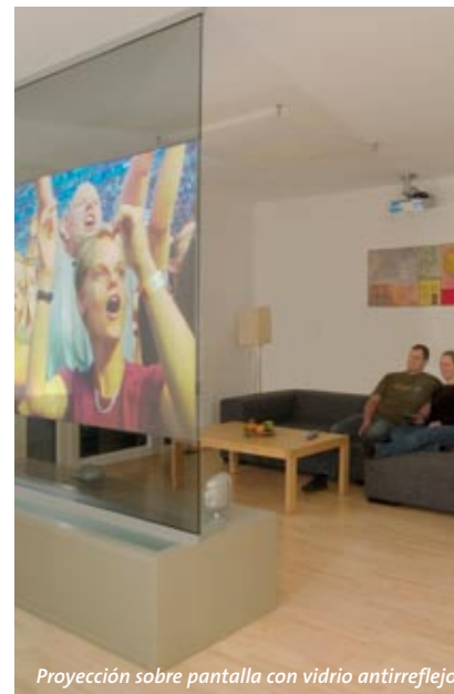
Proyección sobre pantalla con vidrio antirreflejo

sGG VISION-LITE satisface las exigencias de durabilidad de la clase A de la norma europea EN1096.